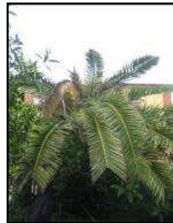
Fig. 4 Asimmetria della chioma e appiattimento

L'esito finale dell'infestazione di Rhynchophorus ferrugineus sui vegetali di palma è la morte della pianta, la cui chioma presenta tutte le foglie secche e ripiegate verso il basso, in una tipica forma ad ombrello.