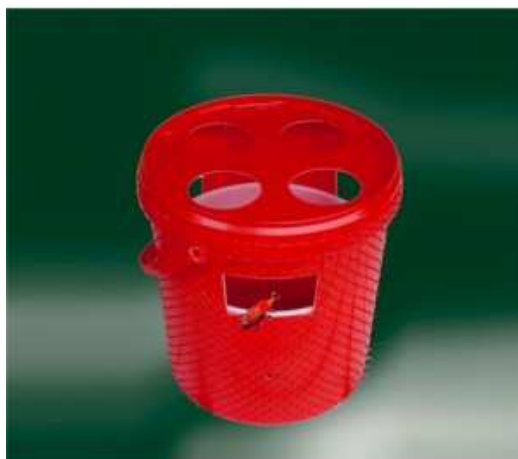
Fig. 1. Trappola a feromoni