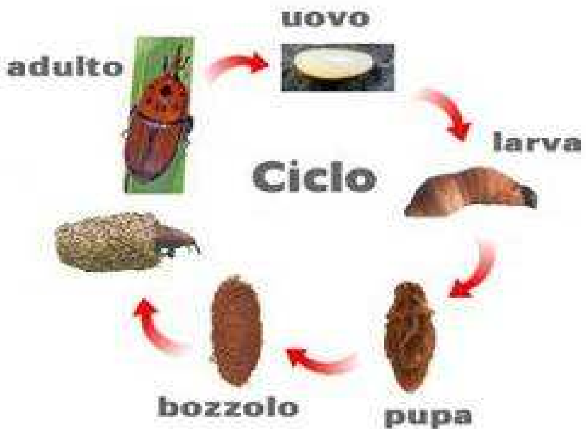
Fig. 2 Ciclo biologico del punteruolo

Negli areali di origine, caratterizzati da un clima caldo tropicale, il punteruolo rosso compie più generazioni nel corso dell'anno ognuna delle quali si completa in circa 3 mesi e mezzo. La femmina vive circa 3 mesi e depone in media 200 uova nelle ferite delle palme, dopo 2-3 gg dall'ovideposizione nascono le larve, che completano lo sviluppo in 2-3 mesi; mentre la durata del successivo stadio pupale varia da 15 a 50 giorni.