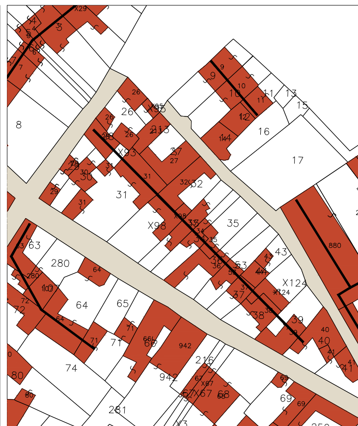
Case con doppia corte con affaccio, ed ingresso, a sud-ovest ed allineamento nord ovest - sud est