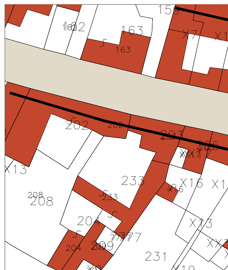
Le prime case, "palattu", con affaccio su strada