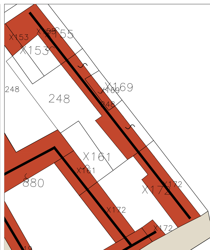
Le case a corte doppia dei "grandi contenitori" con annessi locali strumentali per la trasformazione dei prodotti agricoli.