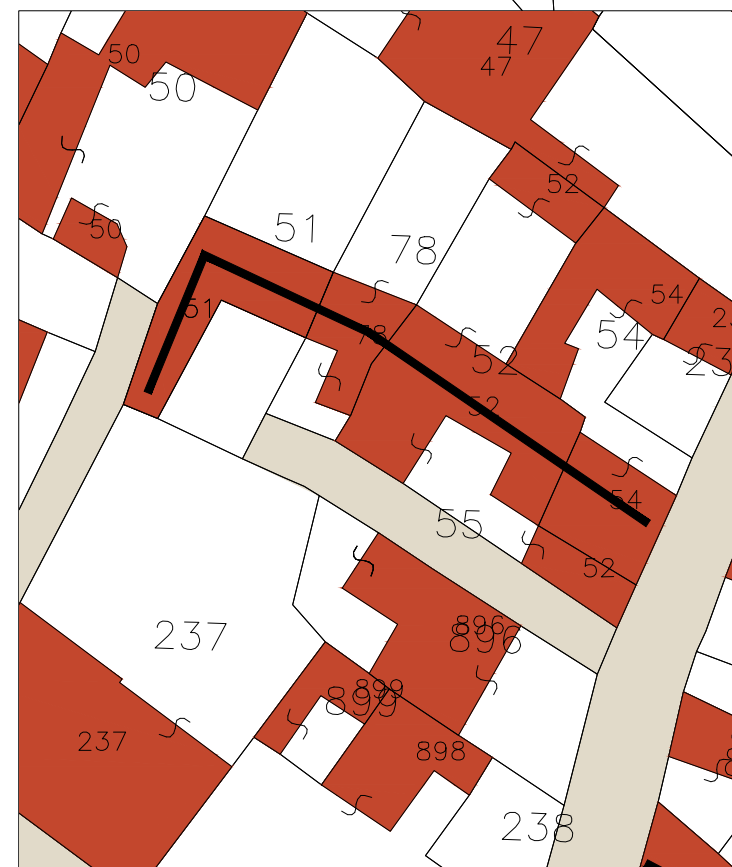
Gli isolati originari, definiti dalla rete di percorsi di collegamento a scala territoriale, vengono divisi più volte dal meccanismo del frazionamento fondiario e incisi dai vicoli delle penetrazioni.