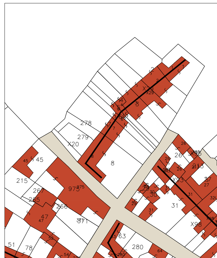
Case con doppia corte con affaccio, ed ingresso, a sud-est ed allineamento sud ovest - nord est

Il succedersi di frazionamenti di terreni ed abitazioni tende a far assumere alla forma urbana configurazioni ramificate e labirintiche. I nuovi percorsi possono giungere a saldarsi e a determinare la frattura dell'isolato.